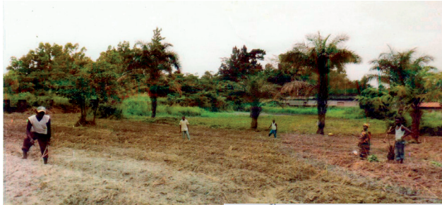
Micro projet Verwimp