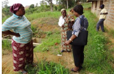
Visite du chantier du généralat