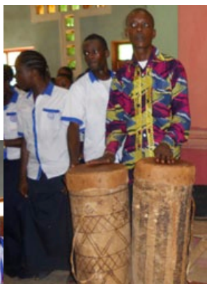
Chorale de Kintanu