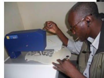
Fabrication d'hosties avec la nouvelle machine et sa bénédiction