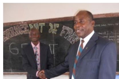
Ntoya lors de la soutenance de sa thèse