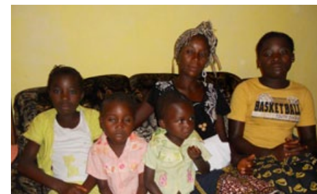
La maman et ses filles Masonga