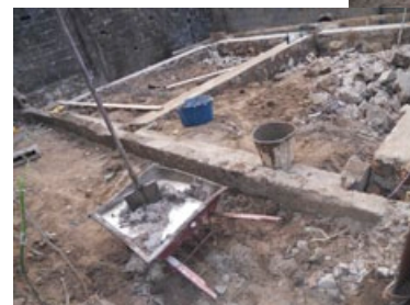
Construction du nouveau poulailler